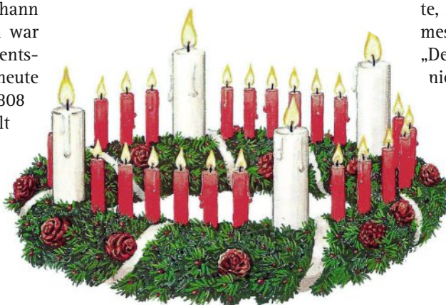
Bildquelle/Zerchnung: Das Rauhe Haus

kranz noch vergleichbar mit einem Wagenrad und hing von der Decke. Erst zwei Jahrzehnte später kam Tannengrün hinzu, zwischen den Kerzen befestigten Helfer noch weiße Bänder. Eher aus praktischen Gründen verschwanden allerdings zu Beginn des 20. Jahrhunderts die kleinen Kerzen vom Kranz. Grund: Es wurde Brauch, in den bürgerlichen Wohnstuben ebenfalls Kränze aufzustellen. Doch sie waren mit den vielen Kerzen schlicht zu groß. Wer heute einen Adventskranz nach dem alten Vorbild haben möchte, muss mindestens mit einem Durchmesser von 60 Zentimetern planen. „Der Wichern’sche Adventskranz sollte nicht zu klein ausfallen, weil die Kerzen sonst zu dicht nebeneinanderstehen und einfach wegschmelzen“, empfiehlt das Rauhe Haus in einer Anleitung. Auch schwankt die Zahl der Kerzen je nach Kalenderjahr zwischen 21 und 28. Dieses Jahr sind es 20 rote, Heiligabend fällt auf einen Mittwoch. (Quelle: Red.)