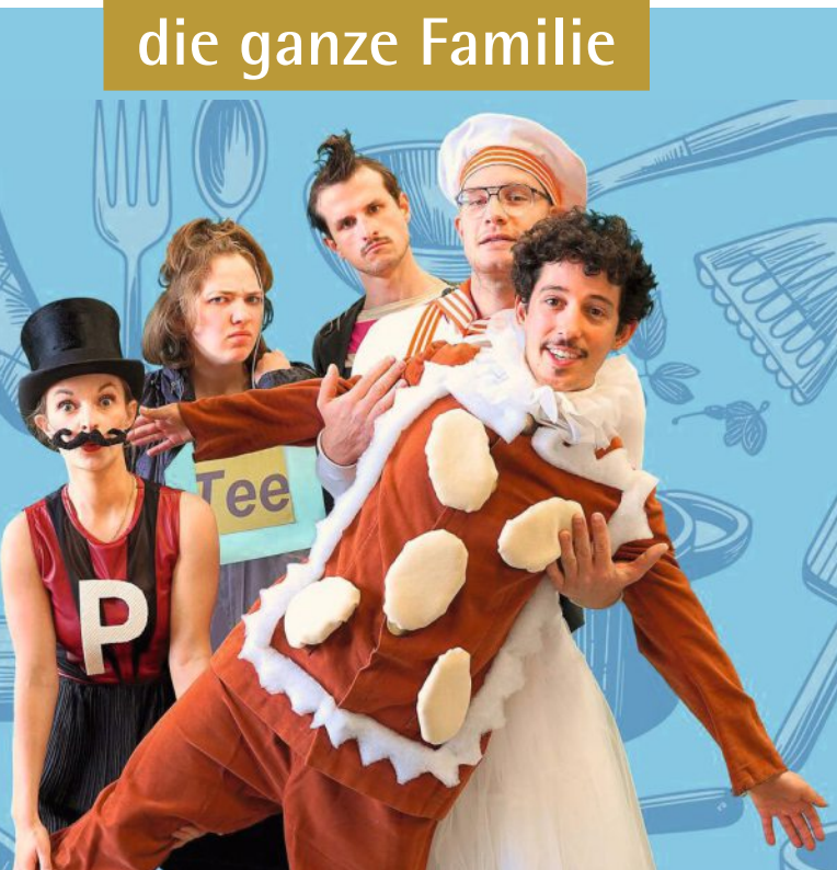
Das Musical „Der Lebkuchenmann“ ist im Dezember im Schlosstheater Celle zu erleben.

Im Küchenschrank ist der Teufel los! Herr von Kuckuck, Schweizer Präzisions-Ansager der Kuckucksuhr, ist heiser! Doch für einen Kuckuck einer Kuckucksuhr kann es ganz schön gefährlich werden, wenn man seine Stimme verloren hat. Die großen Menschen schmeißen oft schon nur leicht beschädigte Dinge in die Mülltonne, und so ist die Situation für ihn ziemlich brenzlich. Was tun? Fräulein Pfeffer und Herr Salz möchten ihren Freund nicht verlieren, sie bitten einen neuen Schrankbewohner, den frisch gebackenen Lebkuchenmann, um Hilfe. Der soll für den erkrankten Herrn Kuckuck einen Löffel Honig besorgen. Nur zu dumm, dass der Honig vom alten, übellaunigen Teebeutel verwaltet wird und sich zudem im obersten Regal befindet. Aber gemeinsam ist man stark! Und so beginnt für alle Bewohner der Küchenanrichte eine abenteuerliche Reise.