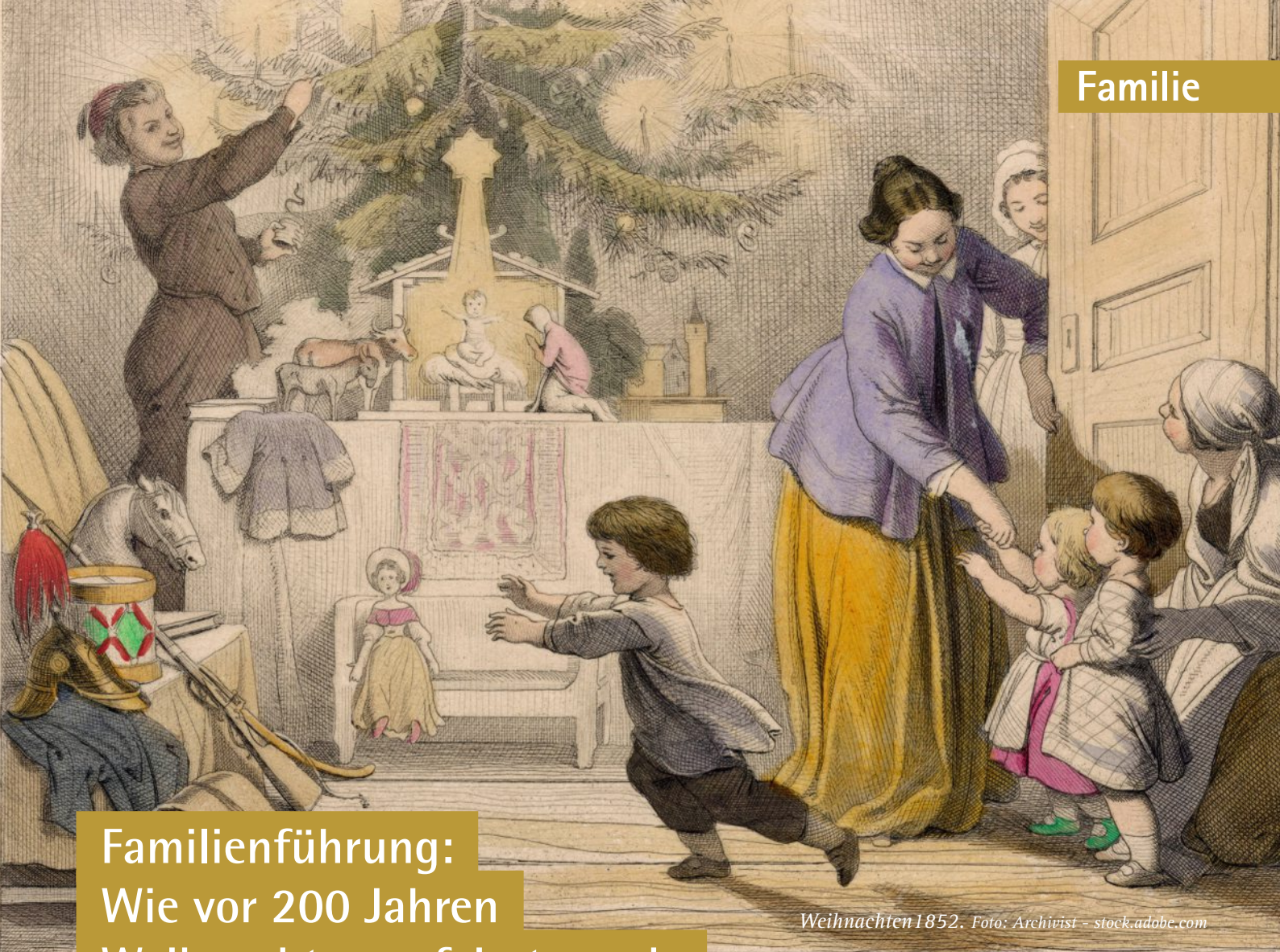
Weihnachten 1852.