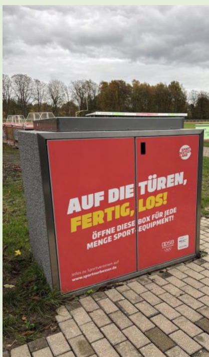
Die Box ist prall gefüllt mit Sportgeräten, die kostenlos ausgeliehen werden können.

stimmig zu. Mit dem Kulturpreis ehrt der Landkreis Celle Persönlichkeiten, die sich in besonderer Weise um das Gemeinwohl in den Bereichen Kultur, Umwelt oder soziales Engagement verdient gemacht haben. Der Preis ist mit 2.000 Euro dotiert. (pm-lkc)