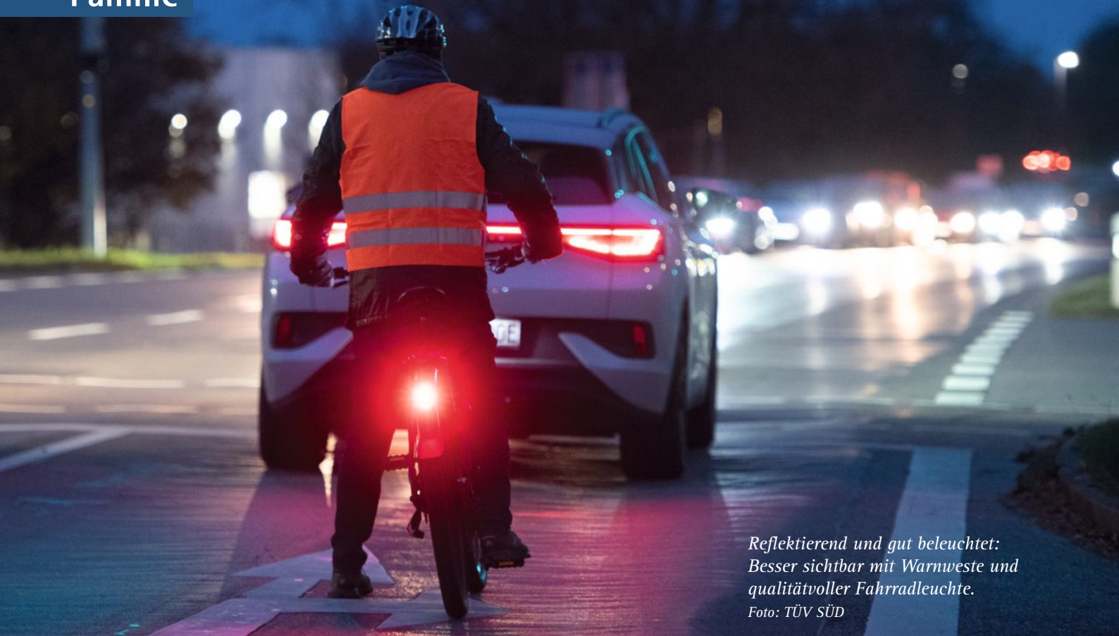
Reflektierend und gut beleuchtet: Besser sichtbar mit Warnweste und qualitätvoller Fahrradleuchte.