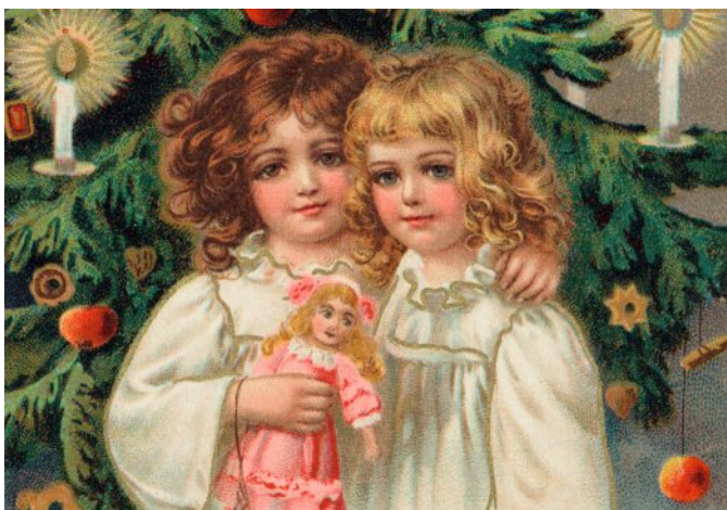
Weihnachten 1880.

Eintritt: Die Führung ist kostenlos, es wird nur der Museumseintritt erhoben. Informationen zu den Eintrittspreisen und Ermäßigungen: www.bomann-museum.de/Information/Eintrittspreise