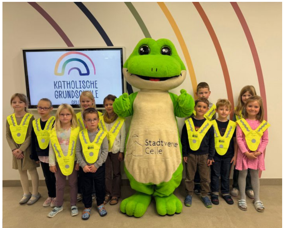
Kinder der Katholischen Grundschule Celle mit den neuen Warnüberwürfen.

Auch Haustiere werden bei Dämmerung häufig zu spät gesehen. „Wer beispielsweise in der Dämmerung oder nachts mit seinem Hund unterwegs ist, sollte darauf achten, dass Mensch und Tier frühzeitig gesehen werden“, rät der Produktexperte. Für die Vierbeiner gibt es leuchtende oder reflektierende Halsbänder, Brustgeschirre und Leinen, die die Sichtbarkeit erheblich erhöhen. Wichtig ist, dass die Lichtquellen gleichmäßig und rundum leuchten, damit das Tier aus allen Richtungen gut erkennbar bleibt. Modelle mit Dauerlicht sind häufig die bessere Wahl, da sie andere Verkehrsteilnehmer weniger irritieren als schnell blinkende LEDs. USB-aufladbare Modelle sind umweltfreundlicher als Batterielösungen und halten meist mehrere Stunden. (Quelle:PM)